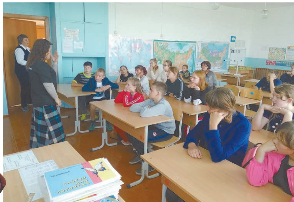
Благодаря проекту Музей без границ школьники расширят кругозор, получат серьезные профориентационные знания.