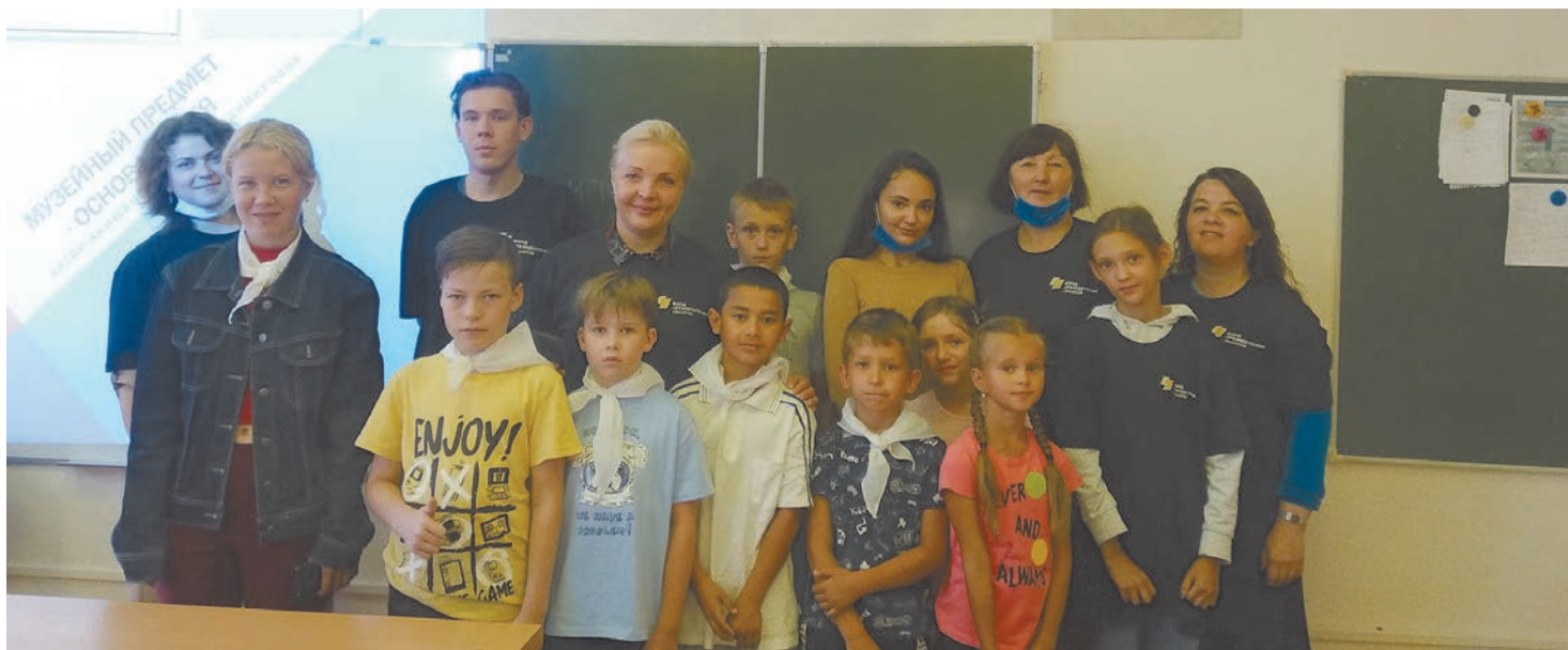
Команда будущих музейведов в Перевалово.